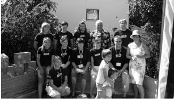
Die Helden der KJG Rosenberg

Wand, die neu gestrichen werden musste. Da das Graben des Lochs sich schwieriger gestaltete als anfangs angenommen, wurde für den Nachmittag ein Bagger bestellt, der in Null Komma nichts das Loch fertig ausgehoben hatte. Somit war der erste Heldentag vorbei und wir gingen alle müde und verschwitzt nach Hause.