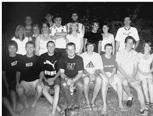
Die Atzmansrichter Helden nach Abschluss der Badeweiher-Renovierung.

Die morschen und verwitterten Sitzgelegenheiten wurden durch neue Eichenbänke ersetzt und erweitert. Zahlreiche Nacharbeiten wurden dann noch am Sonntag erledigt.