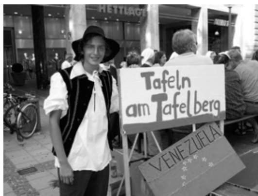
Tafeln wie in Venezuela