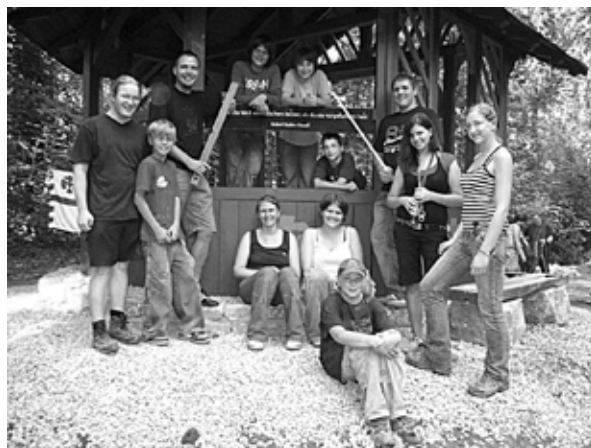
Die DPSG-Stämme St. Jobannis, Neustadt/Aisch und Bischof Otto, Bamberg

Morgens bekamen wir Baumaterialien von der Firma Bauereiß mit einem großem Lastwagen auf dem kleinen Feldweg geliefert. Danach wurde noch fertig geschliffen und mit dem Streichen des restlichen Holzes begonnen. Gleichzeitig wurde der „Burggraben“ befestigt durch ein Gemisch aus Schotter und Sand. Kurz vor dem Mittagessen wurde angefangen Beton zu mischen, dies wurde wegen maschinellen und kräftlichen Problemen gestoppt. Diese Probleme wurden durch ein anständiges Mittagessen (Hähnchenschenkel und Kartoffelsalat bzw. Brötchen von unserem Sponsor) behoben. Zudem wurde eine neue Mischmaschine von Herrmann Loscher organisiert. Zum leib-