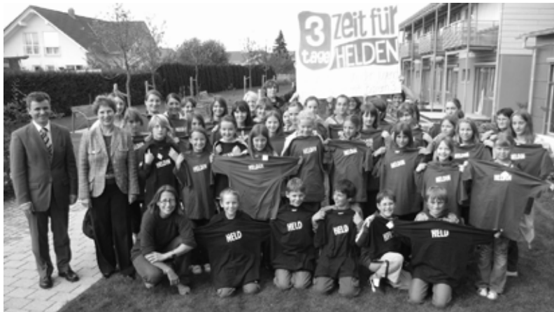
Helden und Heldinnen des Kinderhospiz St. Nikolaus