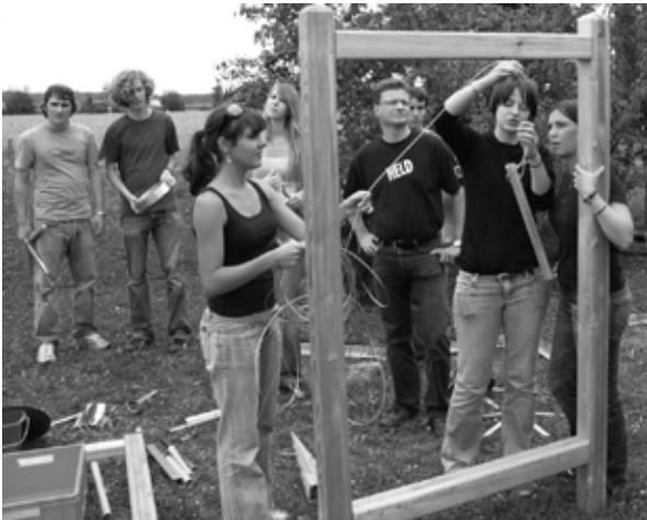
Bernd Sibler (im Rahmen links) beim Besuch einer Heldengruppe im Landkreis Deggendorf