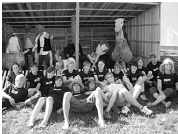
Das Projekt „Heufigurenkrippe“ der KLJB Loizenkirchen