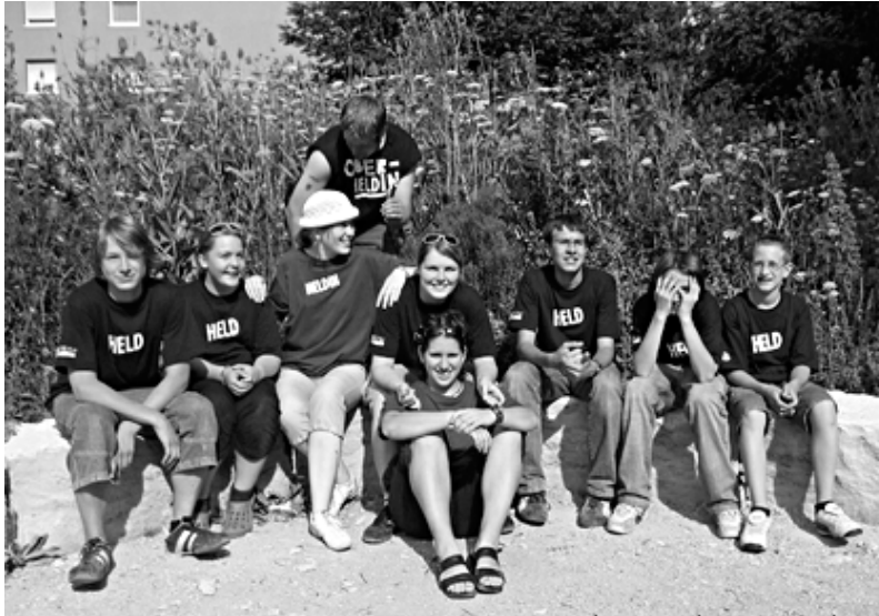
KJ St. Peter und St. Willibald Ingolstadt

sprachliche Schwierigkeiten galt es oft zu überbrücken. Unser Auftrag war es, Farbe in die dunklen Haushalte zu bringen. Anschließend mussten wir die Daten ins Computerprogramm eingeben. Am Samstag Abend wurden die Angaben dann ins System übernommen und programmiert.