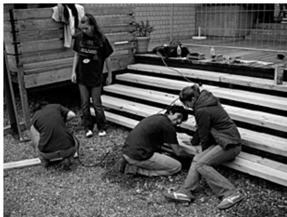
Renovierung des Martin-Luther-Kindergartens

Doch ganz von Pannen verschont wurde dieser Tag dann doch nicht: Zwei unserer Mädels verliefen sich auf dem Weg zwi-