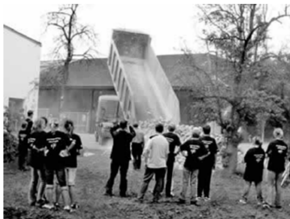
Anlieferung des Baumaterials

Der Platz hinter dem Kloster und dem Egbert-Gymnasium musste in schweißtreibender Arbeit dazu vorbereitet werden. Mittags lieferte der erste LKW eine 30 Tonnen-Ladung Muschelkalk-Bruch-