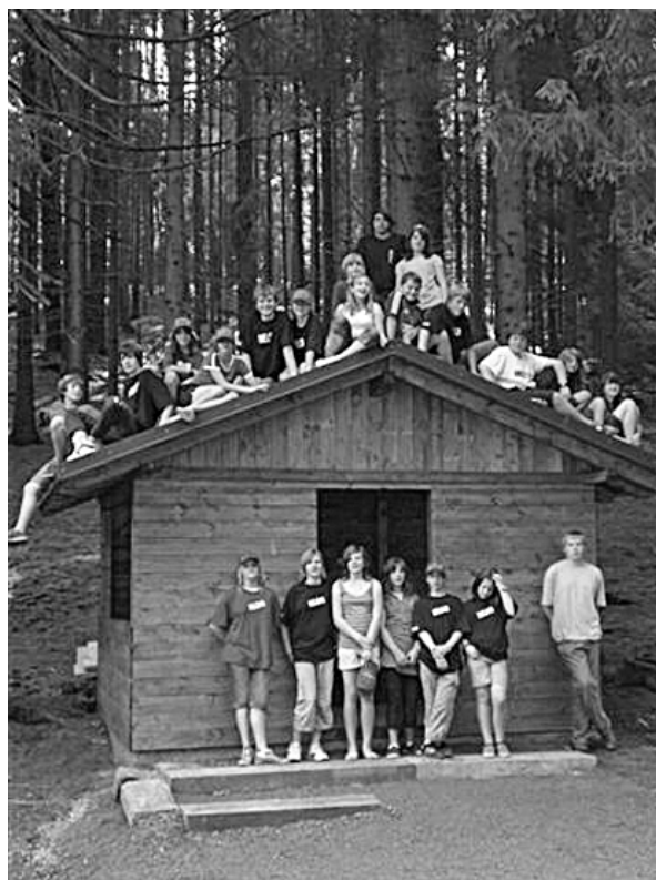
MINIS Hessenthal-Mespelbrunn vor und auf ihrer neu errichteten Schutzhütte