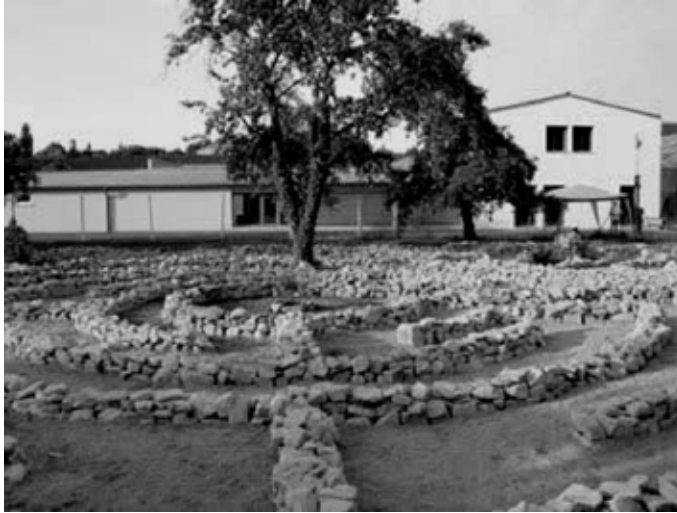
Das fertige Steinlabyrinth von Münsterschwarzach

feileistungen binnen kürzester Zeit zu beschaffen verstand. Dazu gehörten u.a. 17 Tonnen Splitt für die Wege des Labyrinthes, der von der Firma LZR noch am Samstagnachmittag zur Verfügung in Kitzingen gestellt wurde. In einer ungeheuerlichen Leistung wurden die 17 Tonnen mit Eimern bis 23 Uhr auf die Bahnen des Labyrinthes geschüttet und verteilt.