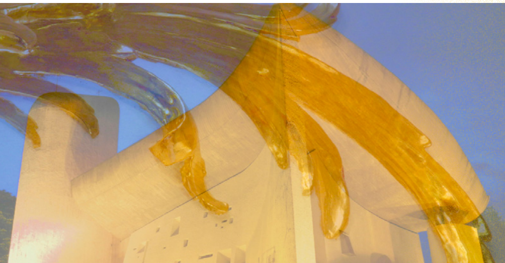
TEXT UND FOTOARBEIT (NOTRE DAME DU HAUT, RONCHAMPS, 20. JH.; DETAIL ROKOKOSTUCK IN DER GNADENKAPELLE „UNSERER LIEBEN FRAU“, HOHENPEIßENBERG, 18. JH.): ULI WINKLER, WWW.ULIWINKLER.DE

Vielen Dank für die Unterstützung und Verbundenheit im vergangenen Jahr! Wir wünschen ein frohes und gesegnetes Weihnachtsfest sowie ein glückliches neues Jahr 2017!